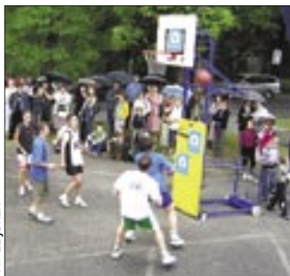
W czasie festynu rozegrany został mecz koszykówki pomiędzy drużyną franciszkanów a drużyną z Kopernika

Późnym wieczorem, już przy lepszej pogodzie, uczestnicy festynu mogli podziwiać przygotowany na ten dzień pokaz sztucznych ogni. M.