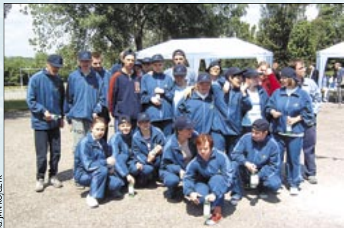
Dzień Dziecka w WTZ-tach już na stałe wpisał się w kalendarium działalności warsztatów

z Krakowa oraz przejażdżki na koniach. Każdy z uczestników otrzymał również sympatyczny upominek – płytę CD zespołu Arka Noego pt. „Wakacje cały rok”. Spotkanie zakończyło się potańcówką przy muzyce i konsumpcją pieczonych kiełbasek. Takie imprezy to nie tylko zabawa, ale również szeroko pojęta rehabilitacja społeczna uczestników.