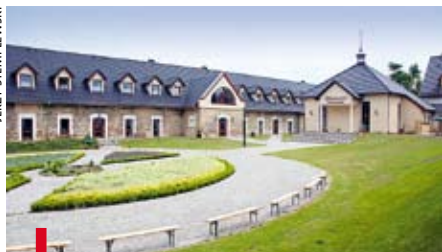
Sanatorium „Sebastianum Silesiacum” w Kamieniu Śląskim dysponuje bogatą ofertą dla kuracjuszy