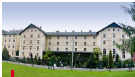
Ośrodek „Skowronek” w Głuchołazach odwiedzają kuracjusze i młodzi koloniści