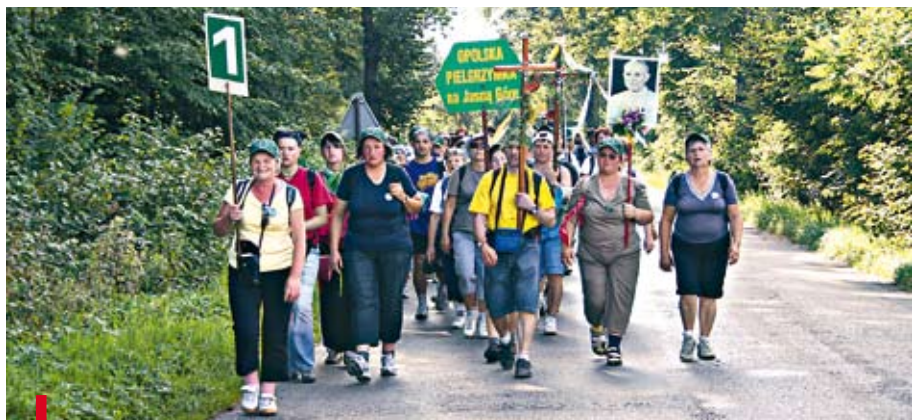
Pielgrzymka z Opoli na Jasną Górę podąża od 1977 roku