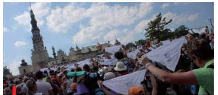
...i w końcu upragniony cel – Jasna Góra