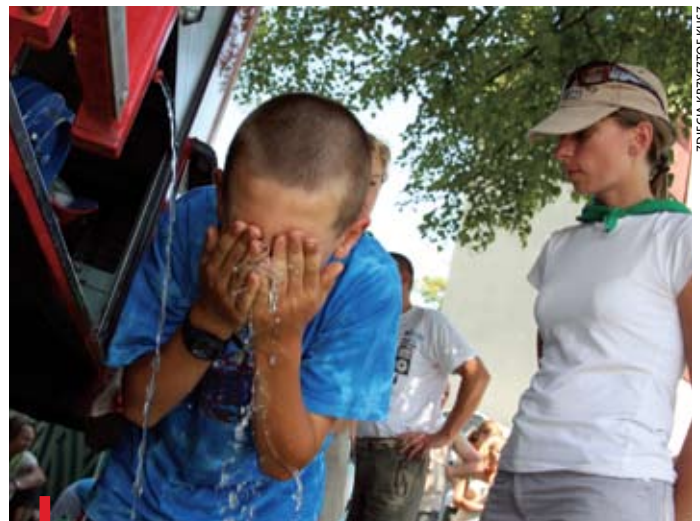
W tym roku pątnikom upały dały się we znaki