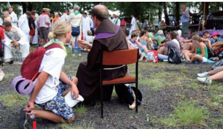
Postoje na trasie to także okazja do spowiedzi