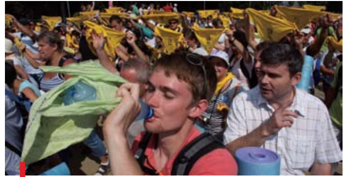
Ostatni łyk wody...