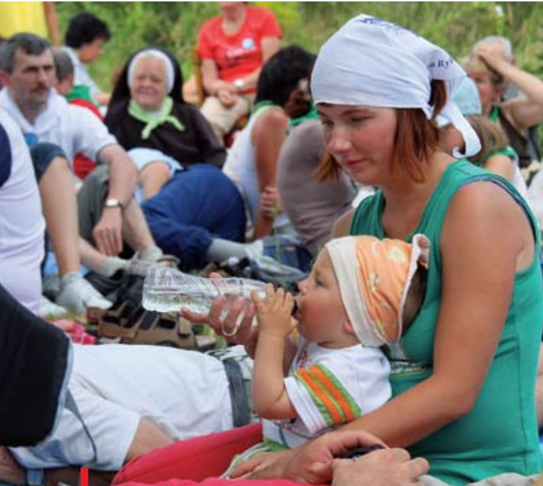
Pielgrzymują już nawet kilkumiesięczne dzieci