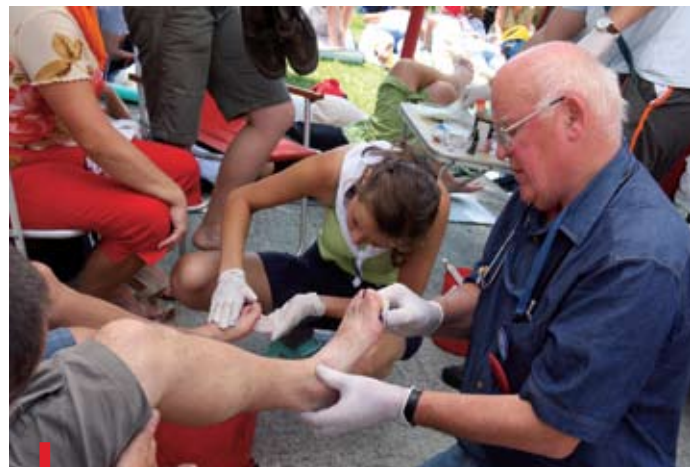
Odciski to dla pielgrzymów normalność