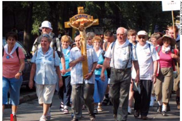
Pierwsza grupa pielgrzymów wyrusza na trasę