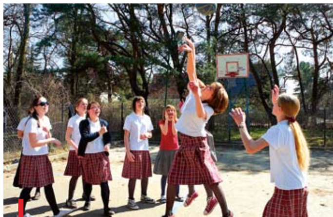
Jak twierdzą zwolennicy edukacji zróżnicowanej, rozwój dziewcząt przebiega znacznie szybciej niż chłopców. Różnica wynosi nawet 7 lat

Europa Zachodnia, Australia, Kanada i USA – we wszystkich tych krajach edukacja zróżnicowana ze względu na płeć, wraca do łask . A uczniowie szkół „single sex” osiągają świetne wyniki w nauce. Dlaczego?