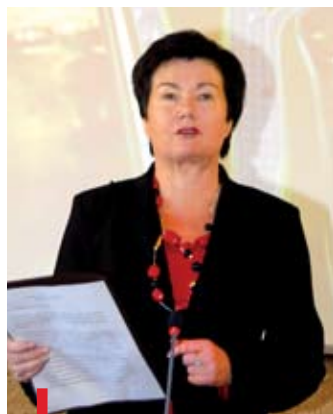
BIURO PRASOWE URM

i efektywnemu korzystaniu ze środków unijnych na inwestycję Warszawa ma aż 4 miliardy 389 mln zł. gr