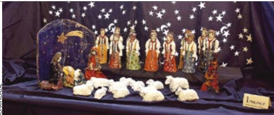
Wystawa szopek w tarnogórskim muzeum