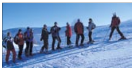
ARC. GIMNAZJUM SALEZJAŃSKIEGO