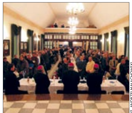
IKSMOCHYWAŁA JEZDNYW KS.

„Słowo – miecz obosieczny” – to hasło 22. Forum Młodych, zorganizowanego w listopadzie przez wrocławskich kleryków