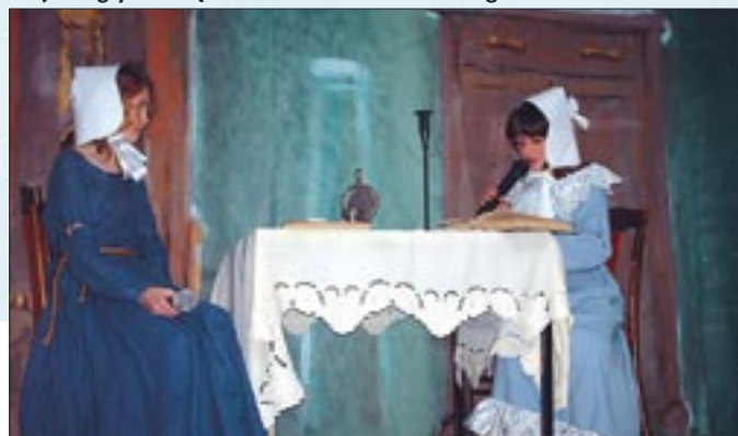
ARCHIWUM SP NR 3