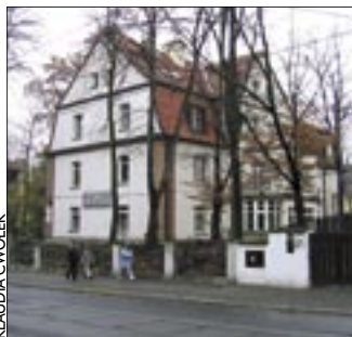
Hospicjum znajduje się przy ul. Daszyńskiego 29

Ofiary będą zbierać pracownicy i wolontariusze do puszek oznaczonej logo hospicjum.