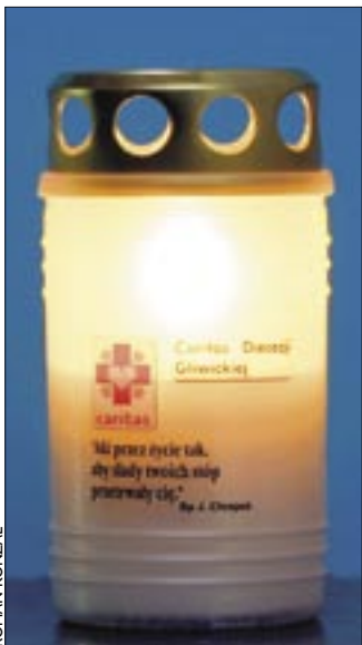
Cena znicza to 2,5 zł, tyle kosztuje obiad dla głodujących dzieci

Cena jednego znicza wynosi 2,50 zł – czyli równowartość jednodaniowego obiadu. Jest co prawda wyższa od tych sprzedawanych przy cmentarzach lub supermarketach, jednak kupując znicz Caritas, pomagamy niedożywionym dzieciom. Znicze są do nabycia w centrali Caritas (gmach kurii gliwickiej). W tym roku Caritas Diecezji Gliwickiej przygotowała 15 tys. świec. ■