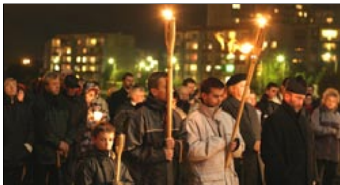
W Zabrze młodzież spotkała się pod krzyżem papieskim

W Dniu Papieskim o godzinie 21 w sześciu miastach diecezji gliwickiej młodzież rozpoczęła modlitwę o beatyfikację Jana Pawła II.