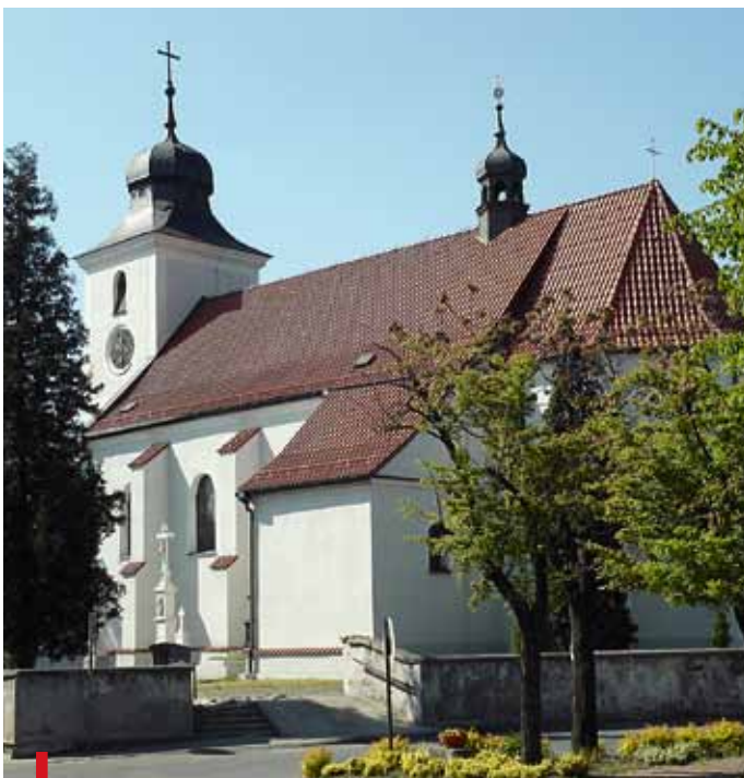
Kościół św. Jakuba Apostoła w Sośnicowicach – cel diecezjalnego Camino

Już za tydzień na wzgórzu piekarskim specjalne wydanie Gościa Niedzielnego