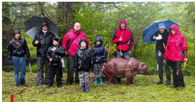
Zawodnicy strzelali do 14 gumowych figur zwierząt, rozstawionych na terenie zamku i parku w Toszku